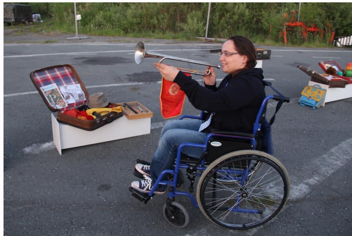
«ИСТОРИЯ В ЧЕМОДАНАХ»