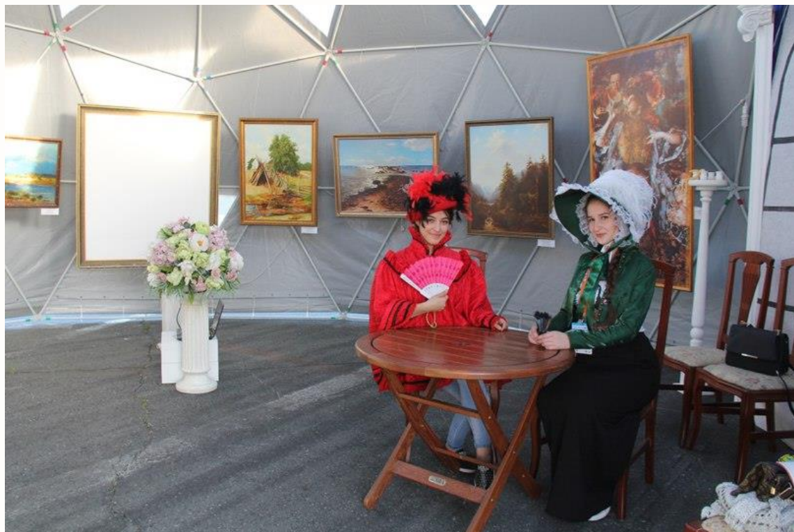
«САЛОН МОД» и «УРОК ХОРОШИХ МАНЕР»