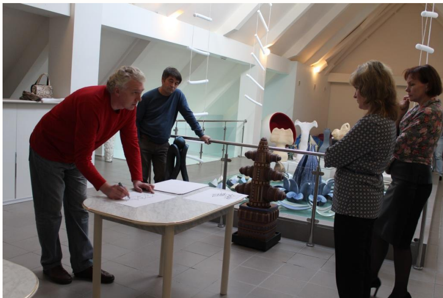
ЭКСПО-МАСТЕРСКАЯ «СТИРКА ПАМЯТИ»